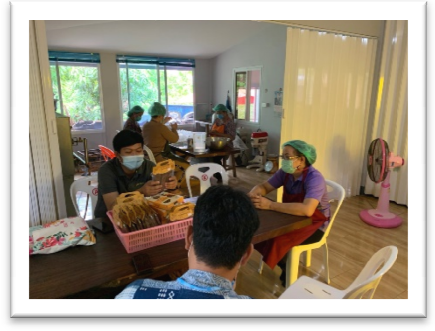
วิสาหกิจชุมชนทำขนมและแปรรูปผลิตภัณฑ์ทางการเกษตร บ้านเมืองจ้งเหนือ ม.๕ ต.เมืองจ้ง ผลิตภัณฑ์ งาม้อนปรุงรสน้ำผึ้ง