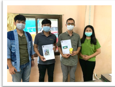
กลุ่มแปรรูปผลิตภัณฑ์บ้านกอก ม.๑ ต.ท่าน้าว ผลิตภัณฑ์ ไชร์ปมะไฟเงิน