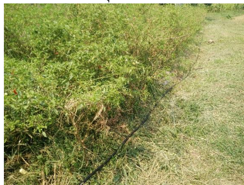
ใช้ระบบน้ำหยดในแปลงพริก