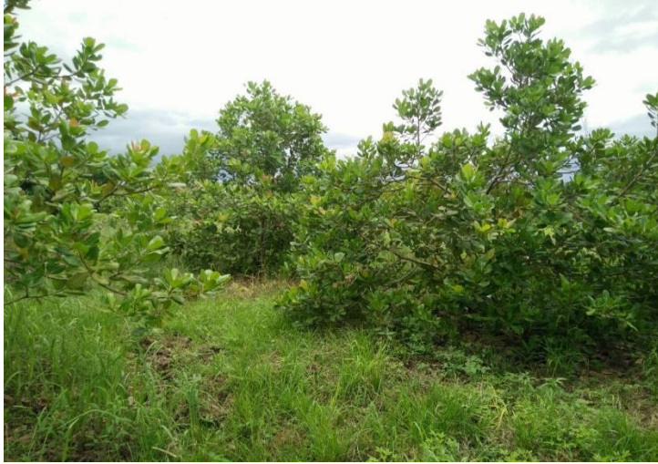
มะม่วงหิมพานต์ อายุ ๓ ปี จำนวน ๕๐ ต้น ในพื้นที่ ๑ ไร่