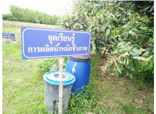
ทำปุ๋ยหมักไว้ใช้เอง โดยใช้เศษพืชหรือวัสดุเหลือใช้ มูลสัตว์