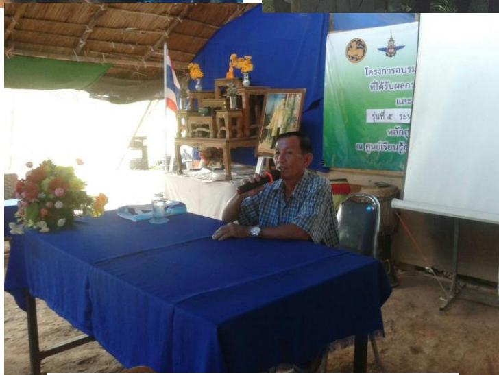
เป็นวิทยากรบรรยายการผลิตลำไยคุณภาพ