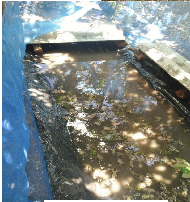
การเลี้ยงกบในกระชังใต้ต้น