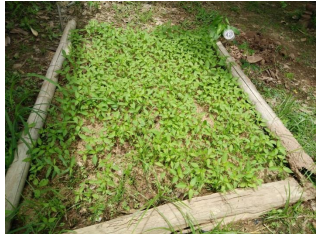
พริกโรงงาน(พันธุ์เขียวมณี) พื้นที่ ๒ ไร่ และพริกชี้ฟ้า ๒ งาน