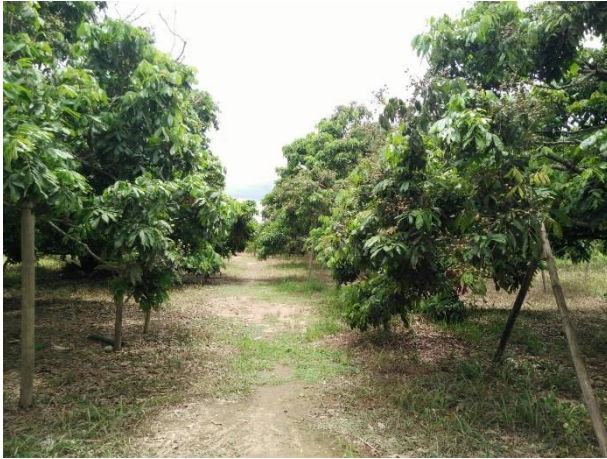
ต้นลำไยอายุ ๓๘ ปี จำนวน ๑๕๐ ต้น ในพื้นที่ ๕ ไร่