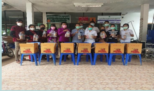
การมอบเครื่องดื่มน้ำมัลเบอร์รี่ ชา กาแฟ แก่โรงพยาบาลบ่อเกลือ