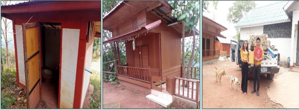
การสร้างกุฏิ ๑ หลัง ๒ ห้องนอน ห้องน้ำ ๑ ห้อง พร้อมโต๊ะหมู่บูชา แก่สำนักสงฆ์บ้านสะแก