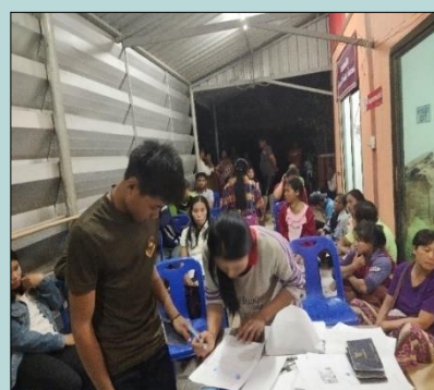
การจัดสวัสดิการให้สมาชิก การเพิ่มราคาการรับซื้อ/เงินปันผล/และเงินออม