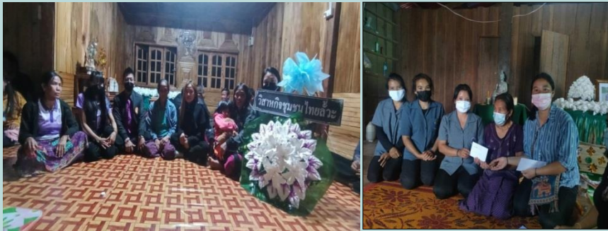
มอบเงินช่วยเหลือในงานต่าง เช่น งานทำบุญ งานศพ