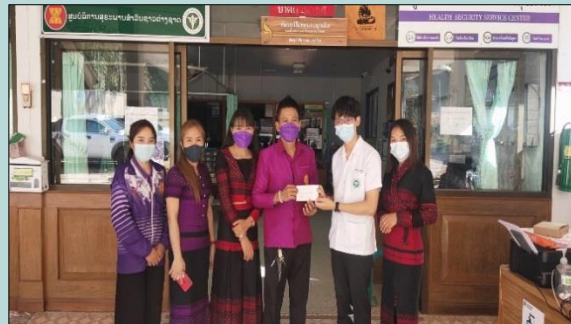
มอบทุนการศึกษาโรงเรียนในพื้นที่และมอบเงินสนับสนุนบำรุงอาคารสถานที่โรงพยาบาล